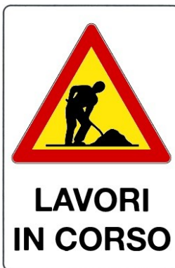
Lavori in corso