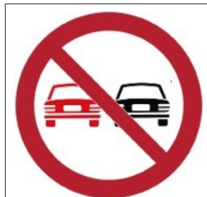
Divieto di sorpasso